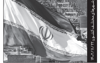
تصاویری از راهپیمایی پرشور مردم بصیر در شهرهای مختلف کشور ۱۴۰۲/۱۱/۲۲

بصیرت و حضور پرشور ملت ایران در راهپیمایی ۲۲ بهمن ۱۴۰۲، نشان دهنده چیست؟