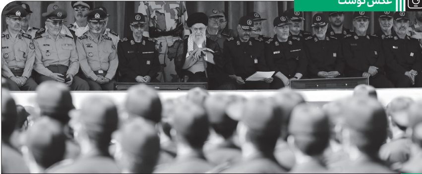
مراسم دانش آموزی دانشجویان افسری و تربیت پاسداری دانشگاه امام حسین علیه السلام، ۱۳۹۷/۴/۹